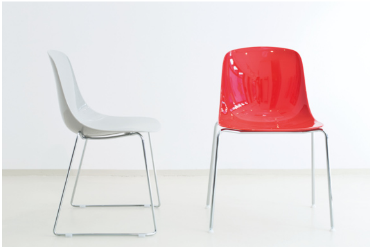
Abbildung PURE_KC siliziumgrau